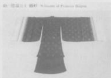
图 3 德温公主绿圆衫