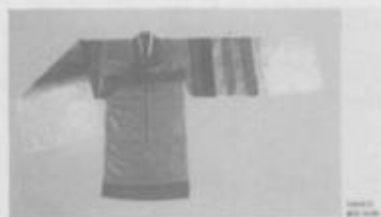
图 4 民间绿圆衫