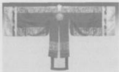
图 2 英王妃红圆衫