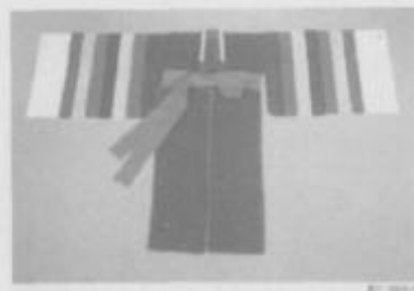
图 5 民间青圆衫

福”、“多男”等吉祥文字，衣服上则绣有牡丹唐草纹，腰间的大红缎带具有显示身份地位的作用，缎带上粘接着龙纹金箔，宫中妇女中只有皇后的服饰上才可以装饰龙纹。这件黄圆衫不但雍容华贵而且吉祥如意，色彩艳丽却不失秀雅，是国庆日或者同等重要的场合，皇后穿着的大礼服。黄圆衫在前胸后背和双肩共贴有四个圆补，圆补上的图案是以五爪龙为样式的云龙纹，用金线绣在上面。而在王室庆典的时候，皇后穿着的小礼服也是黄圆衫，与大礼服的区别在于此时圆衫只有两个圆补，分别贴在前胸和后背，圆补上的图案为双凤纹。这里所说的圆补也称为胸背，在中国古代服饰上称之为补子，产生于中国明代，是用来区别官员等级的标志。补子是一块约40~50厘米见方的绸料，织绣上不同纹样，再缝缀到官服上，胸背各一。文官的补子用鸟，武官用走兽，各分九等。韩国朝鲜时期王室受到中国的明朝服饰制度的影响，把补子也应用在了本国的宫廷服饰上，但不是照搬不变，到了朝鲜王朝后期逐渐形成了自己独特的风格。如：在中国明代皇后等妇女的礼服上是不修饰补子的；而在韩国朝鲜时期，根据身份等级皇后等妇女的礼服上也可以修饰补子即圆补。